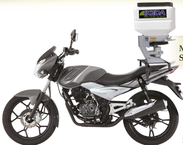
MOTO SEMEADORA MS-40 Semeadora / Adubadora